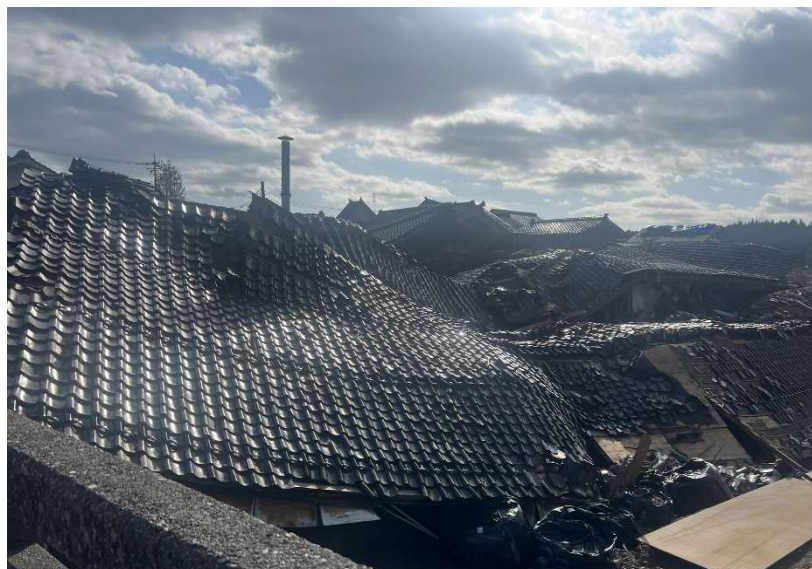
1月11日撮影 能登松波の酒蔵・松波酒造 私の友達です。

SNS で注意喚起のつもりか愉快犯なのかはわかりませんが、情報の混乱がある中で、偽情報が拡散し、不安が増幅されたことは残念ではありますが、このような試練の状況の中でも、日本人の優しさと支援の手が広がっていることに、深く感じ入っています。