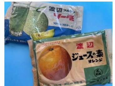
水でのばして作ります