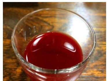
これがスッポンの血。本来はアルコールで割って使います